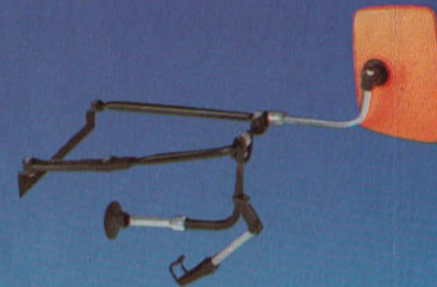
Caravan-Spiegel · Caravan Mirrors · Rétroviseurs caravaning · Espejo retrovisor para caravanas · Specchi caravan · Husvagnsbackspegel · Caravan-spiegels