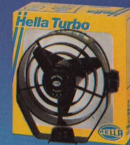
Ventilatoren · Fans · Ventilateurs · Ventiladores · Ventilatori · Fläktar · Ventilatoren