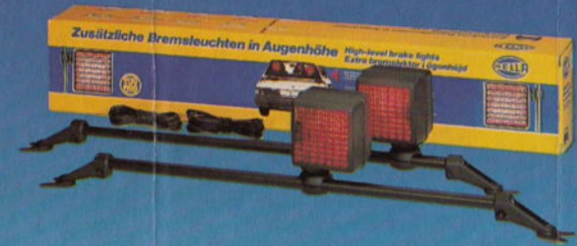
Zusätzliche Bremsleuchten in Augenhöhe · High-Level Brake Lights · Feux de stop additionnels à montage élevé · Luces de freno superiores · Fanali stop supplementari ad altezza d'occhio · Extra-bromsljus i ögonhöjd · Hooggeplaatste remlichten