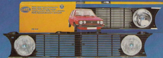
Halogen-Grill-Schlechtwetterscheinwerfer · Halogen-Grill-Fernscheinwerfer · Halogen Grille Bad-Weather Lamps · Halogen Grille Spot Lamps · Projecteurs aux halogènes type «mauvais temps» avec calandre · Projecteurs longue portée aux halogènes avec calandre · Faros halógenos para el mal tiempo integrados en la