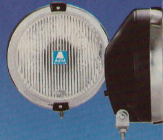
Halogen-Schlechtwetterscheinwerfer · Halogen-Fernscheinwerfer · Halogen Bad-Weather Lamps · Halogen Spot Lamps · Projecteurs aux halogènes