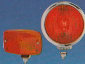
Nebelschlußleuchten · Rear Fog Lamps · Feux AR de brouillard · Luces traseras para niebla · Fanali antinebbia posteriori · Dimbaklyktor · Mistachterlichten