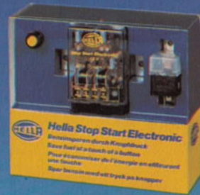
Stop Start Electronic