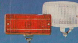
Rückfahrleuchten · Reversing Lamps · Feux de recul · Luces de marcha atrás · Fanali retromarcia · Backstrålkastare · Achteruitrijlampen