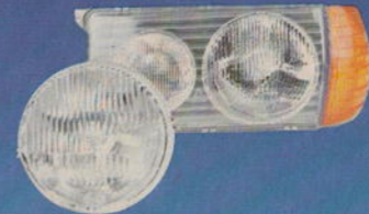
Halogen-H4-Hauptscheinwerfer · Halogen H4 Headlamps · Projecteurs principaux H4 aux halogènes · Faros principales halógenos H4 · Proiettori principali alogeni H4 · Halogen H4 huvudstrålkastare · Halogeen-H4-koplampen