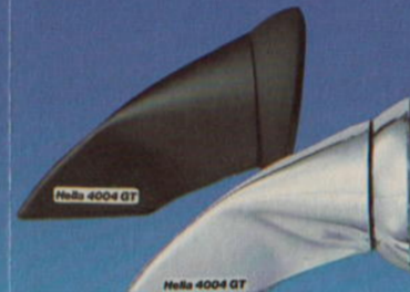
Sportspiegel · Sports Mirrors · Rétroviseurs sport · Espejo retrovisor sport · Specchi retrovisivi · Sport-speglar · Sportspiegels