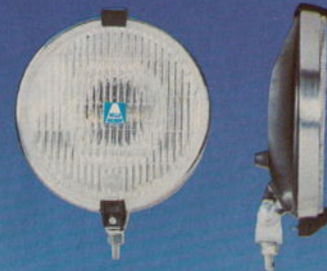
fendinebbia alogeni · Proiettori profondità alogeni · Halogen dimstrålkastare · Halogen fjårrstrålkastare · Halogeen mistlampen · Halogeen vèrstralers