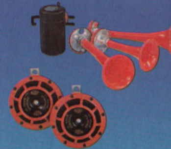
Akustische Signale · Horns · Signaux acoustiques · Señales acústicas · Segnali acusti · Akustika signaler · Horns