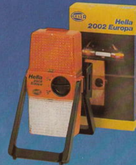
Sicherheits-Warnblinkleuchten · Hazard Flasher Lamps · Lampes clignotantes de sécurité · Luces intermitentes de advertencia y seguridad · Lampade di emergenza lampeggianti · Säkerhets-varningsblinklyktor · Pechlampen